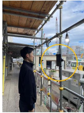
設置例:入退場ゲートや現場事務所の休憩所付近