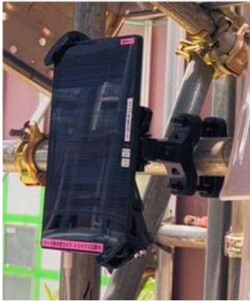
防塵防水タブレット