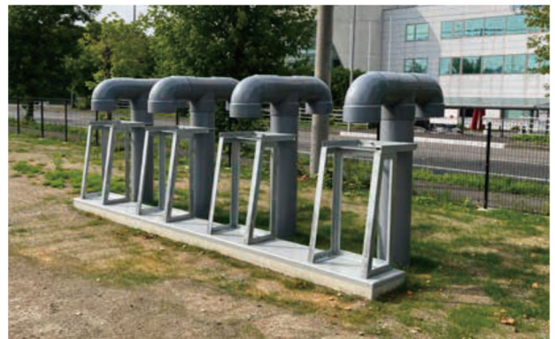
クール&ヒートチューブシステム(外気取入口)