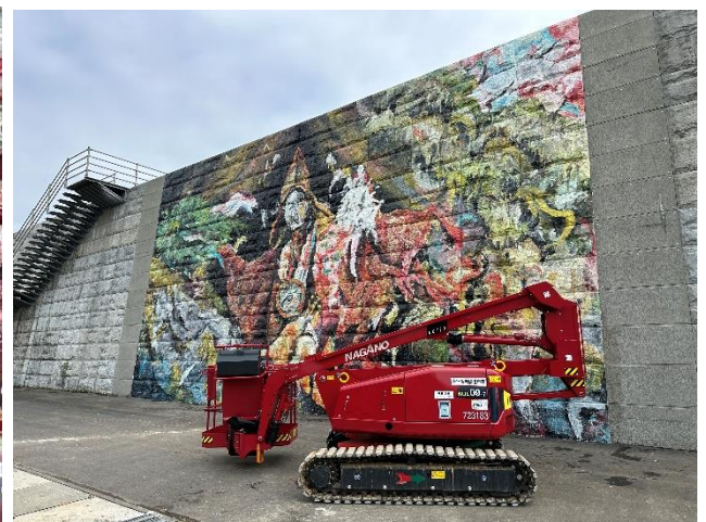
アクティオの高所作業車に乗り、壁画を描く様子